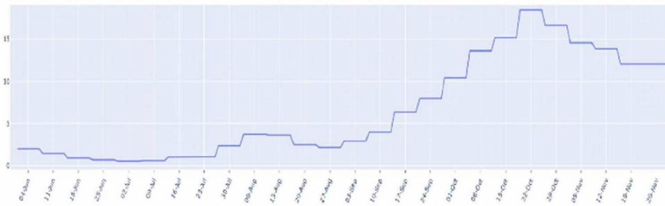
FIGUUR (t/m zondag 29 november): trend in percentage positief landelijk